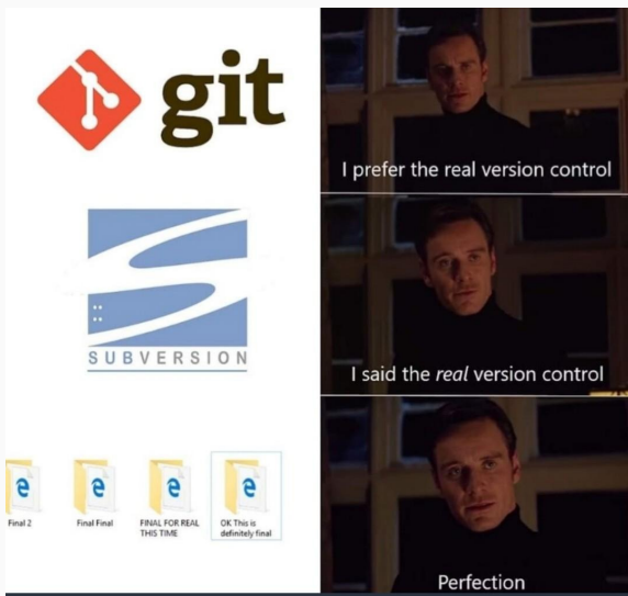
Figure 3: Internet wisdom.